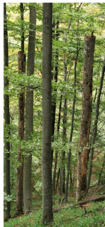
Habitat 9110 cu arbori de biodiversitate și lemn mort