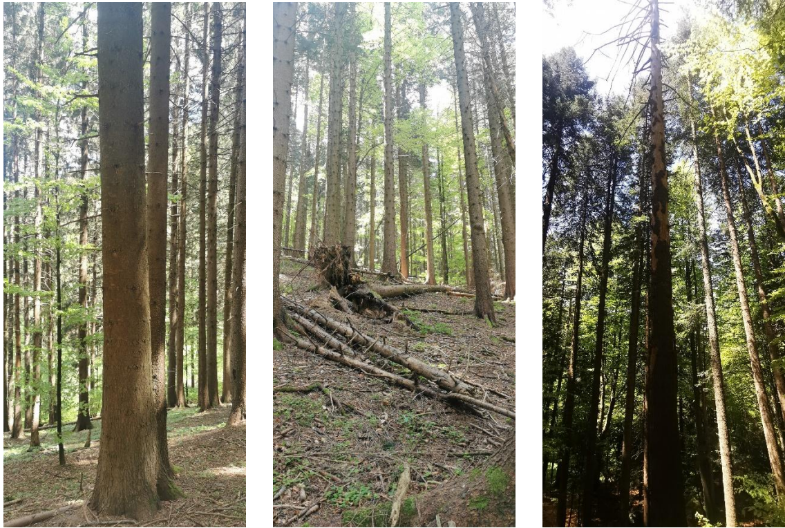
Habitat 9410 cu arbori de biodiversitate și lemn mort